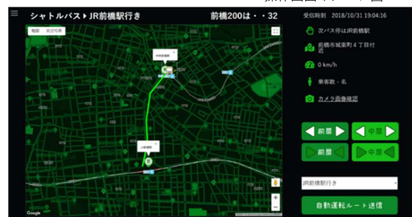
操作画面イメージ図

走行ルート指示・走行状態監視・乗降ドア開閉など、自動運転バスの安全な運行をサポートするための運行管制システム