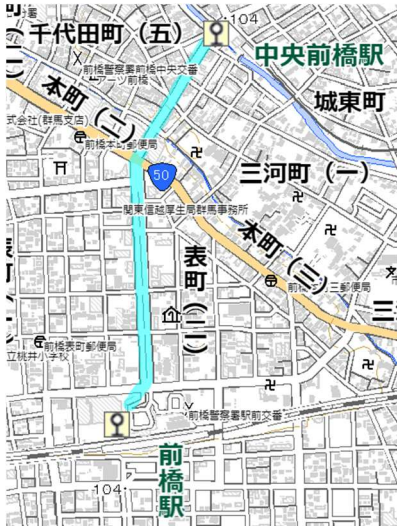
国土地理院の電子地形図（タイル）に走行ルートを追記して掲載