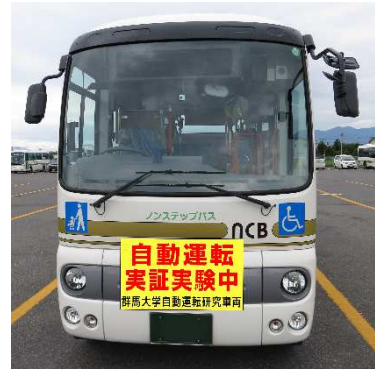
※実験車両と運行経路（イメージ）